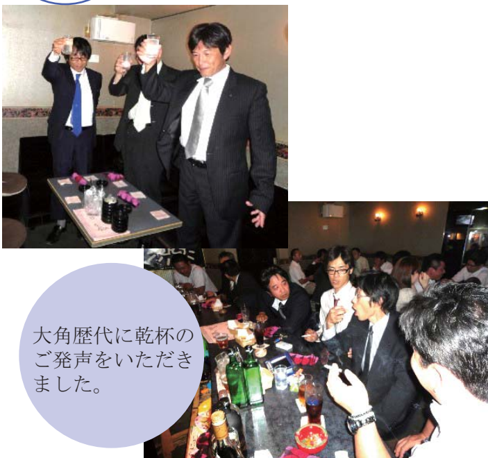
大角歴代に乾杯のご発声をいただきました。

◎と き：同日 21:30～23:30 ◎と ころ：タンパリン ◎参加人数：20名