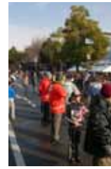
城下町おおがき 新春マラソン

城下町おおがき新春マラソンでたくさんの方に商店街に来ていただきました。ありがとうございます。駅前商店街で用意したモサモサバナナも大好評でした。