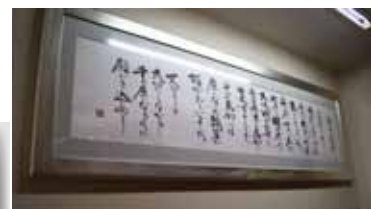
「千房」社名の由来 一人ひとりを大切にしながら・・・ 千の房になるように願いを込めて・・・。