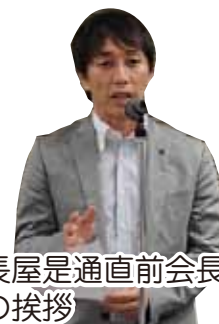
長屋是通直前会長の挨拶

と き：9月17日（水）19:00～20:45 場 所：奥の細道むすびの地記念館 2階会議室 参加人数：38名