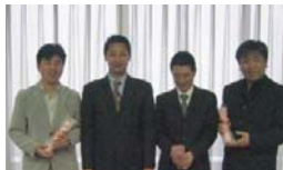
チーム賞 (アウト3組目)