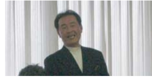
山口特別会員によるあいさつ。含蓄のある言葉をいただきました。