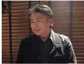
大橋副会長 締めの挨拶