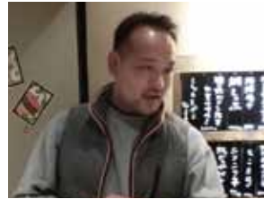
浅野歴代 乾杯の挨拶