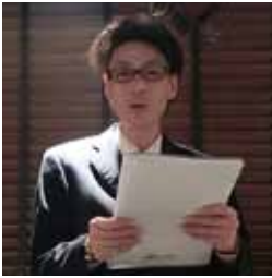
司会進行の稲尾会員副委員長