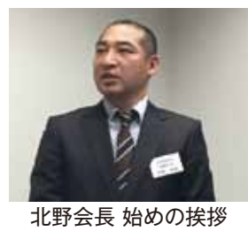
北野会長 始めの挨拶