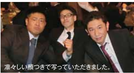
凛々しい顔つきで写っていただきました。