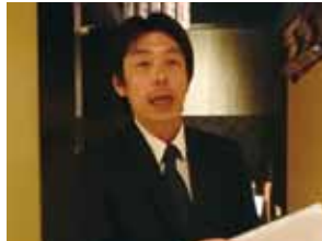
趣旨説明する川瀬会員委員長