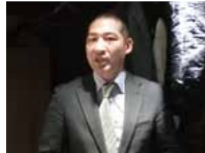
北野会長 始めの挨拶

会員委員会は、右記テーマのもと活動を行っております。現在の充実したOJBの活動を維持し、仲間を増やす為に、1人でも多くの方に当会を知っていただき、入会につながるように勧誘活動しております。来期以降の新入会員候補者の情報収集や共有の場として、今回、お酒を酌み交わしつつ、リラックスした雰囲気でも語りつつ「新入会員情報交換会」を行いました。