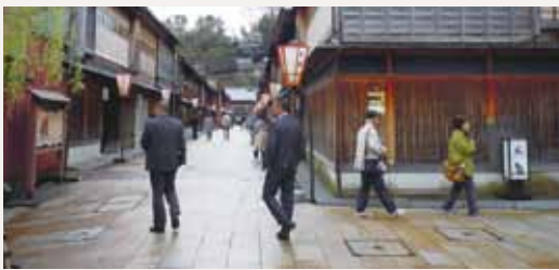
▲城下町の風情が残る茶屋街

金沢の郷土料理で昔から各家庭でつくられていた押寿しをヒントに新しい商品を創造し、今では金沢名物である笹寿司等を製造、販売する会社です。昭和33年創業以来、北陸三県に根差した企業として成長を続けてこられ、冷凍米飯という革新的な技術を得られ、今後全国ひいては世界へ感動を提供することを目標とされています。また日本人の食文化の継承にも力を入れています。訪問する「いなほ工場」は新拠点(新本社)であり、最新鋭の製造設備をご覧いただけます。ご講演後の昼食は、OJ B特製弁当となります。お楽しみに。