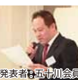
発表者：五十川会員