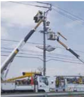
▲ 高所作業車を使用している作業風景