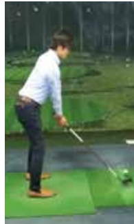
参加メンバーの練習風景になります。