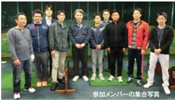
参加メンバーの集合写真