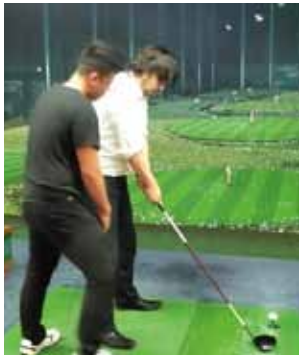
丁寧にアドバイス!! ありがとうございます。