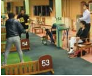
レベルアップを目指して、スイングチェック中です!