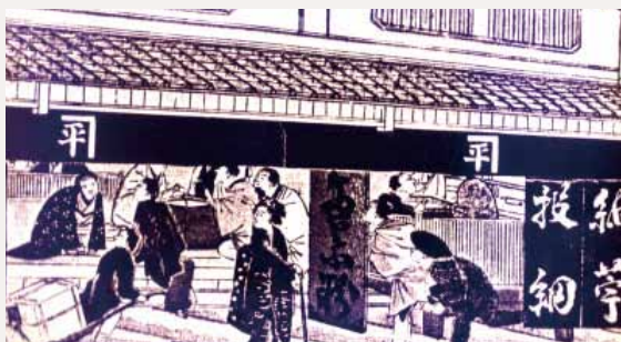
▲ 290年の歴史をもつ近江町市場