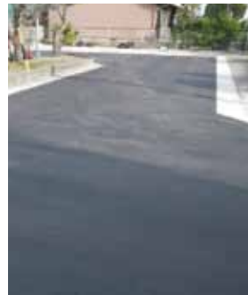
▲ 世安地内 側溝整備工事が完了しました