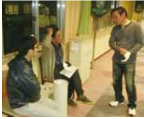
OJB オープンゴルフについて真剣に話し合っています。