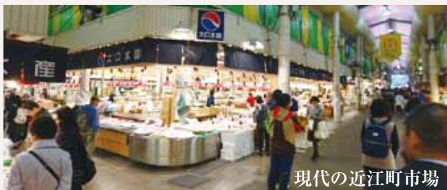
現代の近江町市場

鮮魚屋さんだけでなく、居酒屋やお寿司屋さんなども多数あり、市場の周辺にも魚介以外のお店が沢山あります。新鮮な旬のお魚のお土産ならここで確保してください。