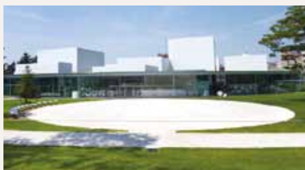
▲ 美術館のコンセプトは、「新しい文化の創造」と「新たなまちの賑わいの創出」