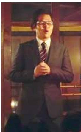
上野例会幹事 中締めの挨拶