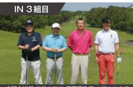
IN 3 組目