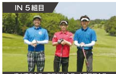
IN 5 組目