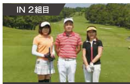
IN 2 組目