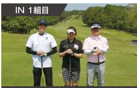
IN 1 組目