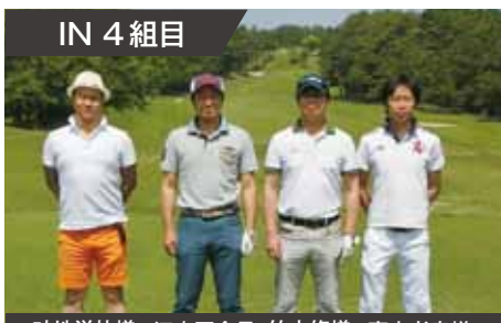
IN 4 組目