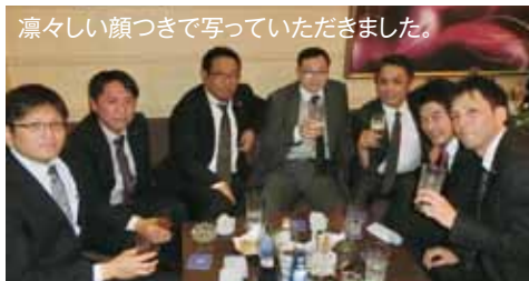
凛々しい顔つきで写っていただきました。

5月例会を担当した広報委員長の二人です。「Web戦略」をテーマに講師例会を開催させていただきました。昨今の情勢を捉えつつ、経営の一助になれば幸いです。ご多数ご出席いただきまして、本当にありがとうございました。