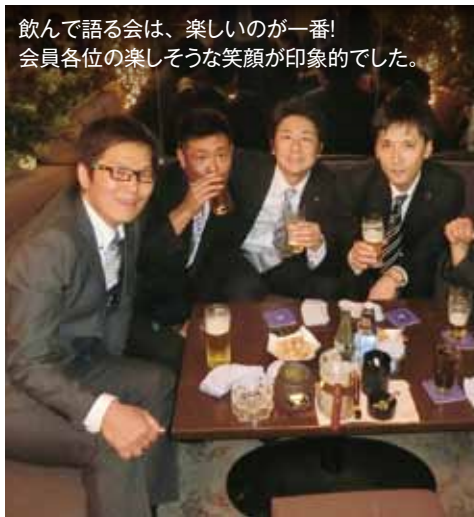
飲んで語る会は、楽しいのが一番！会員各位の楽しそうな笑顔が印象的でした。