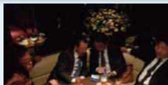
2次会はさらにお酒も進み 大盛り上がり