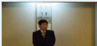
加納会長の挨拶で 合同忘年会が始まりました。