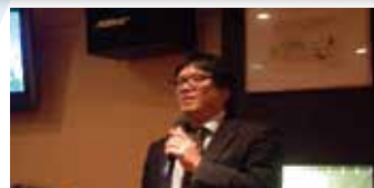
足立幹事長による締めで 楽しい2次会も終了！