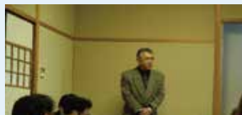
乾杯は羽田特別会員から 頂きました。