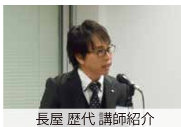
長屋 歴代 講師紹介

平成 29 年 12 月 9 日 ソフトピアジャパンにて 参加者36名 一般聴講者12名