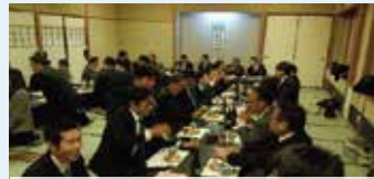
懇親の深まる あつという間の時間でした。

2017年を振り返り、普段交流のできない方々と話をする良い機会となりました。私は、先輩方から経営のお話や、新入会員の方とプライベートな話や、ビジネスの話が出来、とても楽しい時間を共有することができました。こういった話ができる機会が数回しかないのもとても貴重な時間でした。