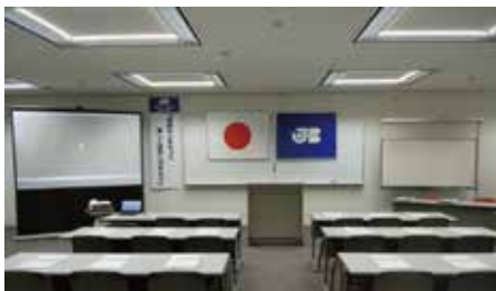
いつもと違う雰囲気の中で役員が一丸となってセッティング