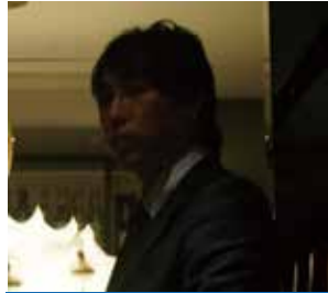
乾杯挨拶 長屋歴代