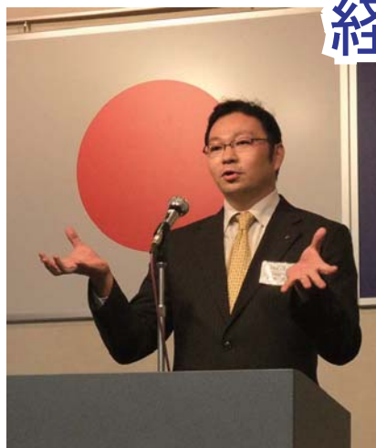
松本会長挨拶で10月例会スタート