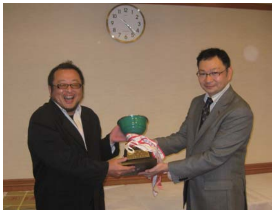
1位の土屋会員。優勝カップを手にして満面の笑み!