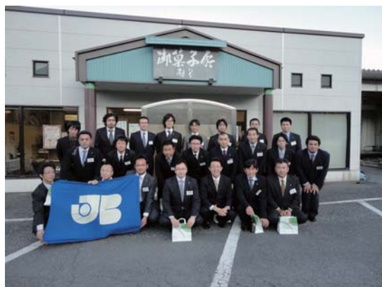
株式会社 榎谷 栗原工場の前で記念撮影

◎と き：11月16日(水) 14:00～16:30 ◎と ころ：株式会社 榎谷 栗原工場 ◎参加人数：22名