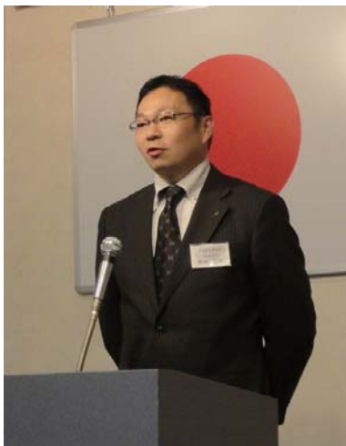
松本会長挨拶で11月例会スタート