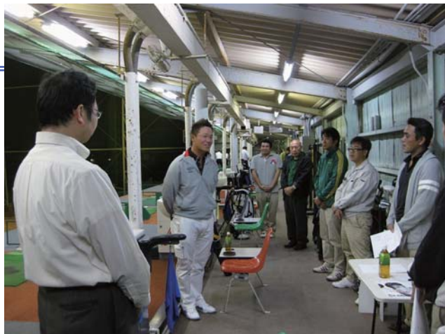
宮本貴之プロのレッスンに真剣に聞き入る会員。的確なレッスンでゴルフの腕も上達!?