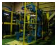
↑タイヤメーカーに納められます