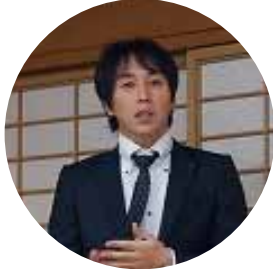
長屋是通直前会長の挨拶