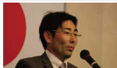
第 52 年度の始まりにあたり所信を語る会長

若者のひきこもり人口は、2016 年 9 月調査時点において、54 万 1 千人と言われており、職場や家庭など、身近な場所でもみられる社会問題となっています。講演では、自己否定により自ら孤立を高めていく傾向の強いひきこもりの支援には、家庭、職場、地域社会の中において、一人ひとりが誰かの「居場所」になることが大切であると、お話いただきました。