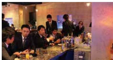
カウンターで各々熱くトークをする会員