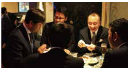
お酒も入り話に花を咲かせていました