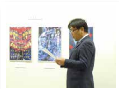
第51年度山口幹事長が 司会を務めました

8月30日 OKB スカイラウンジにて 訪問した際にたまたま44歳の誕生日を迎えた会長が顧問から 記念品を頂く、一コマがありました