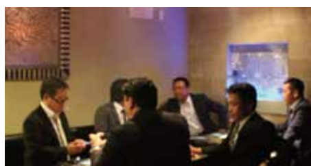
奥の席でも話が盛り上がっていました