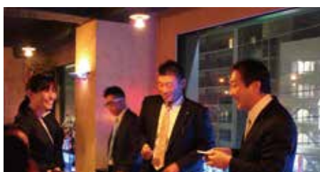
金森新入会員と名刺交換