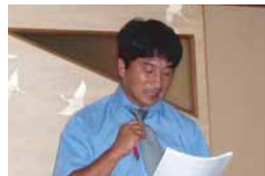
今年度の活動を振り返り、各委員会ごとに発表がなされました

OJBの存在意義、自分にとってのOJBとは、OJBの未来（45周年）に向けての希望、あるべき姿、可能性など、OJBの「翼」について明るく前向きに語り合う。