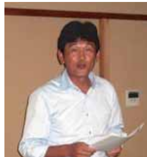
各グループごとの内容を歴代会長に講評していただきました