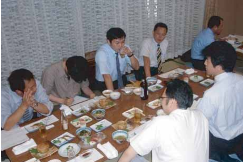
今後のOJBの方向性について、熱心に議論する参加者の皆さん