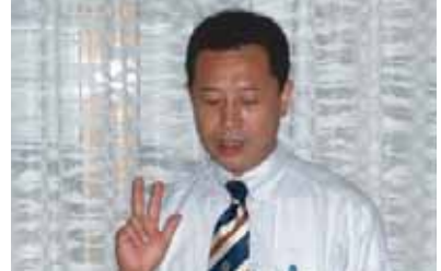
趣旨説明する林長期計画委員長