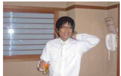
大角歴代の乾杯により討議を開始