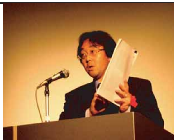
「人生を豊かに、そして社会に役立つ人間で有らねば」と説く矢橋先生