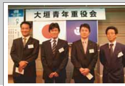
“精出席者”のみなさん