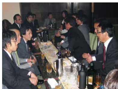
先輩の話に真剣に聞き入る会員