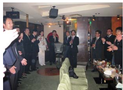
大変、盛り上がりました。