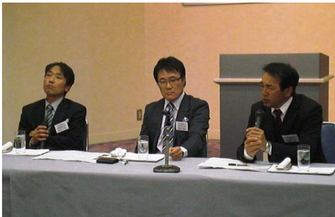
入会当時のことなどを語られる先輩方