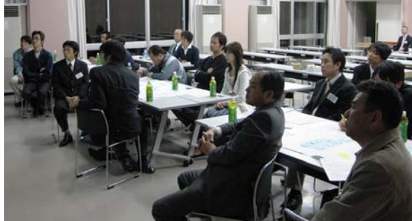
真剣に話を聴く会員のみなさん

「郷土力を培う ～地域環境から地球環境へ～」というテーマのもと 3 回シリーズで行われてきた研修委員会の最後の回となりました。