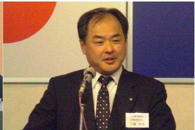
挨拶をする三輪会長