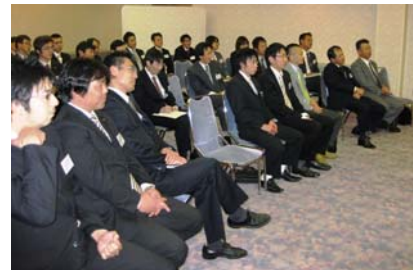
先輩方の語る想いを真剣な面持ちで聴き入る会員の皆様

一生懸命に学ぶこと。 何のために誘ってくれたのかを考えたら簡単には断れない。 誘ってくれた意図を考えるべき。 会員から学ぶことも多くある。