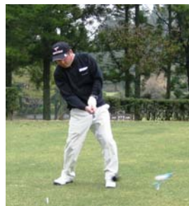
会長による始球式