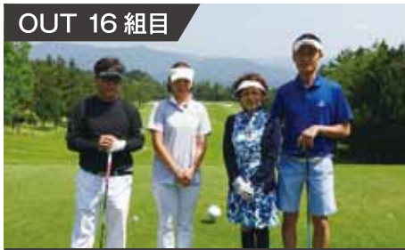
OUT 16 組目