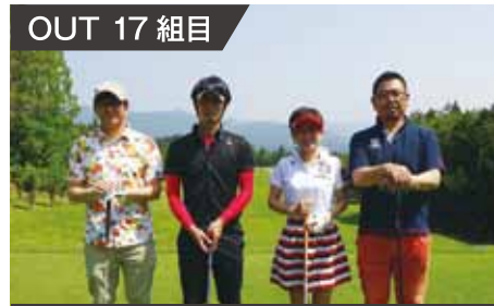
OUT 17 組目