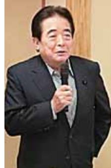
岐阜県議会議員 猫田孝様