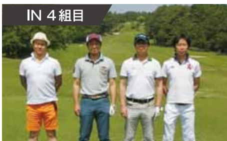
IN 4 組目