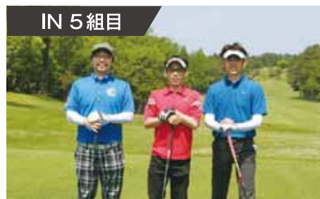
IN 5 組目