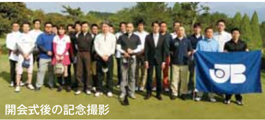
開会式後の記念撮影