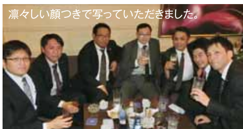
凛々しい顔つきで写っていただきました。

5月例会を担当した広報委員長の二人です。「Web戦略」をテーマに講師例会を開催させていただきました。昨今の情勢を捉えつつ、経営の一助になれば幸いです。ご多数ご出席いただきまして、本当にありがとうございました。