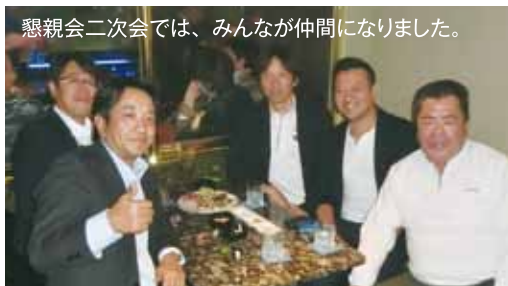
懇親会二次会では、みんなが仲間になりました。