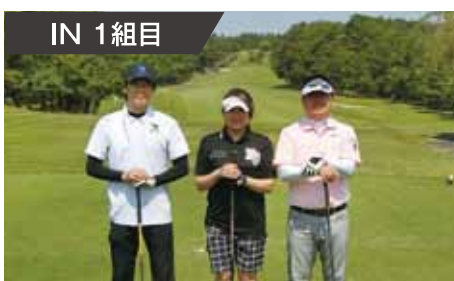
IN 1 組目