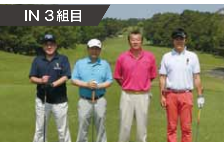
IN 3 組目