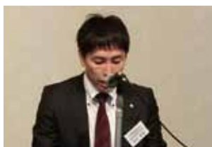
議長 長屋是通歴代会長