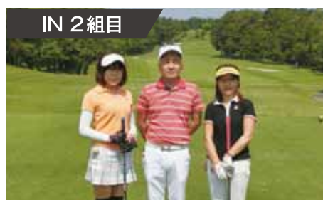
IN 2 組目