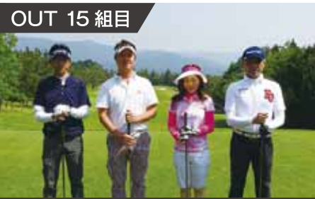
OUT 15 組目