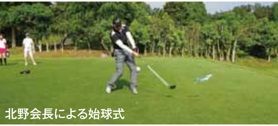
北野会長による始球式