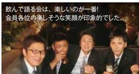
飲んで語る会は、楽しいのが一番！会員各位の楽しそうな笑顔が印象的でした。