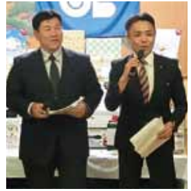
奥田長期計画委員長、西野研修委員長の司会で表彰式スタートしました。