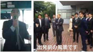
出発前の風景です