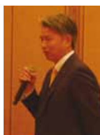
大橋副会長 お礼の挨拶