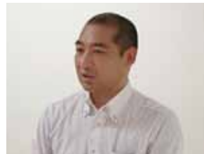
北野会長 始めの挨拶