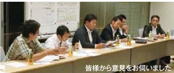
皆様から意見をお伺いました