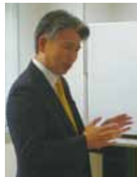
大橋副会長 お礼の挨拶