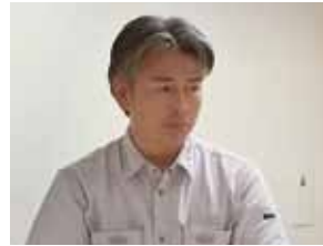
大橋副会長 締めの挨拶

左記は、今年度実施した歴代会長へのアンケートの一例になります。とても貴重なご意見・お言葉が書かれております。会員各位の皆様には、7月例会にて見ていただく力となります。