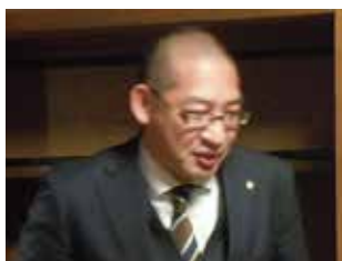
中締め 北野 歴代