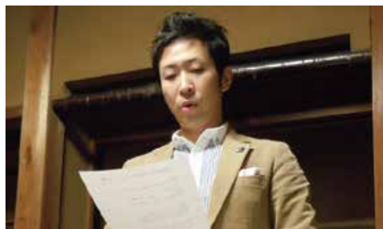
お酒と料理の解説をする近藤先生