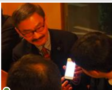
講師を囲む会員たち