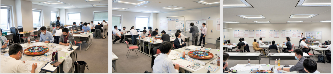
MQ戦略ゲームを終えての感想・気づいたこと(アンケートより抜粋)