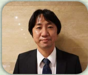
石田市長の講演会を拝聴して