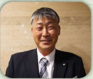
「選ばれるまち 大垣」

市長には大垣西インター付近の企業誘致を頑張っていたいただきたいと思います。また、市長は我々会員の様々な質問にも即座に分かり易くお答えいただきました。しっかりとした市のビジョンをお持ちであり、また大変努力、勉強もされていることがよくわかりました。私も熱い市長に負けないよう、しっかりと大垣に貢献できるような会社になすべく日々の経営を全力で頑張っていきたいと思いません。