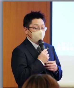
川瀬副会長によるお礼のご挨拶