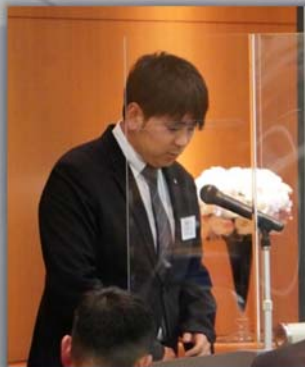
水野長期計画副委員長による司会進行