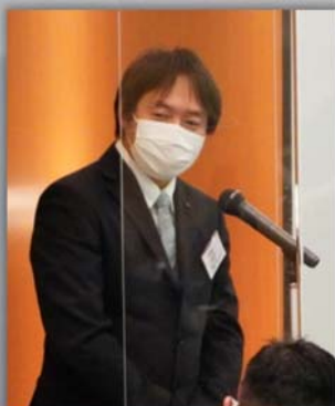
金森長期計画委員長による講師の紹介