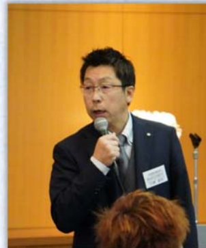
川瀬副会長によるお礼のご挨拶