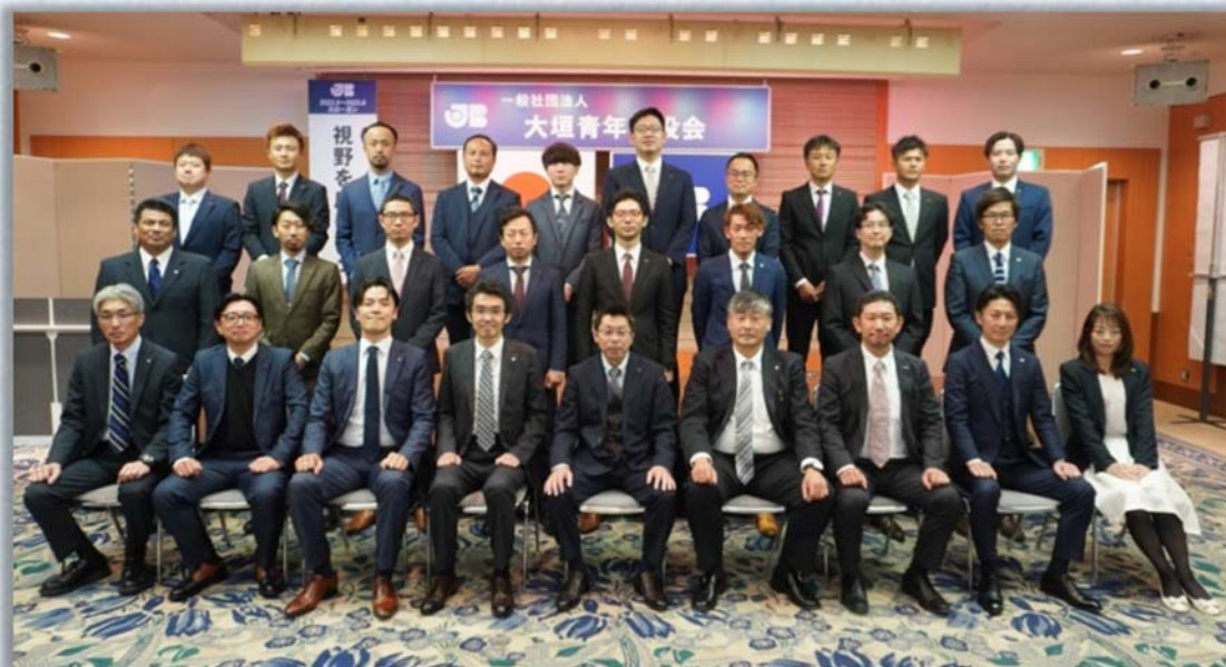
第58年度役員の皆様