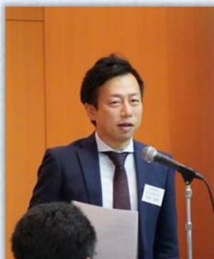
高木広報委員長による講師紹介